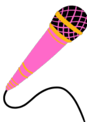
Coral Medianeira - Contatar a Coordenação